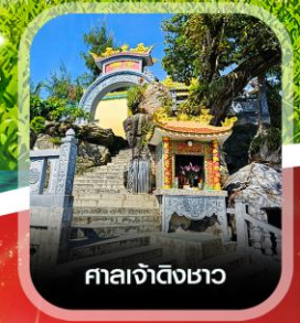
ศาลเจ้าดิงเซา