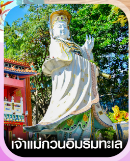
เจ้าแม่กวนอิมริบทะเล