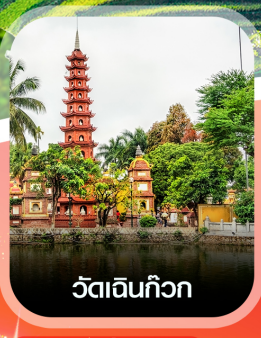
วัดอินทก๊วก

คอนเฟิร์มออกเดินทาง ทุกพีเรียด 2 ท่านขึ้นไป