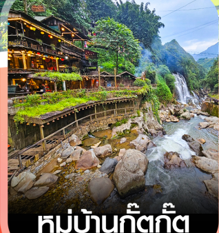
หมู่บ้านก๊วกก๊วก