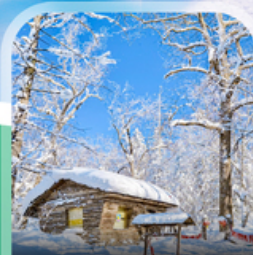
ภาพวาดสีสลับ