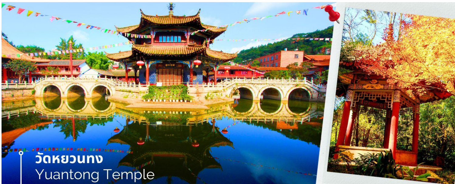
วัดหยวนทอง Yuantong Temple

นำท่านชม วัดหยวนทอง (Yuantong Temple) วัดแห่งนี้เป็นวัดที่ใหญ่และเก่าแก่ที่สุดในเมืองคุนหมิง สร้างมาตั้งแต่สมัยราชวงศ์ถัง มีอายุยาวนานประมาณ 1,200 กว่าปี การสร้างวัดแห่งนี้จะแปลกตากว่าวัดอื่นในจีน เพราะปกติแล้วการสร้างวัดของจีนส่วนมากจะต้องสร้างอยู่บนภูเขา แต่วัดหยวนทองสร้างวัดต่ำกว่าภูเขา โดยวิหารจะอยู่ต่ำที่สุดเนื่องจากวัดแห่งนี้ไม่ได้สร้างขึ้นเพื่อเป็นวัดโดยตรง แต่เคยเป็นศาลเจ้าแม่กวนอิมมาก่อน