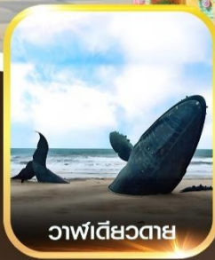
วาฬเดี่ยวตาย

คอนเฟิร์มออกเดินทาง ทุกพีเรียด 2 ท่านขึ้นไป