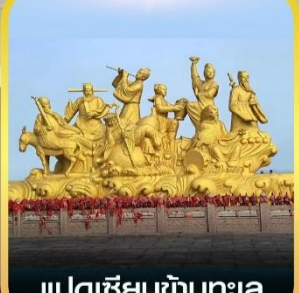
แปดเซียนข้ามทะเล