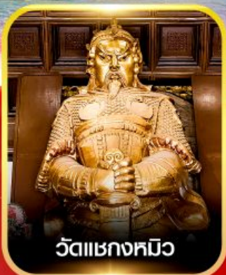
วัดเขงทมิ้ว