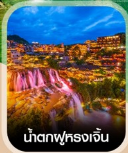
น้ำตกฟูหลงเจิน

สัมผัสสายหมอกแห่งขุนเขา สะพานอ้ายจ้าย แบบพาโรนามา แช่น้ำพุร้อนกลางธรรมชาติ อุทยานป่าไม้บูเออร์เหมิน ชมความอลังการ น้ำตกพันปี หมู่บ้านโบราณผู่หลงเจิน