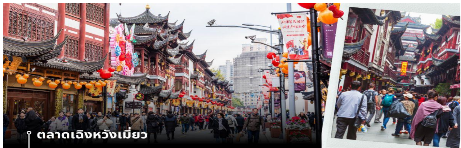
📍 ตลาดเฉินหวังเหมียว

นำท่านเดินทางสู่ หมู่บ้านโบราณจูเจียเจี้ยว มีฉายาว่า เวนิซตะวันออกแห่งเมืองเซี่ยงไฮ้ เป็นอีกหนึ่งย่านเก่าริมน้ำที่มีชื่อเสียงในเซี่ยงไฮ้ มีประวัติศาสตร์ยาวนานกว่า 1700 ปี ซึ่งพื้นที่ทั้งหมดได้รับการอนุรักษ์ไว้เป็นอย่างดี จุดเด่นของเมืองโบราณแห่งนี้คือพื้นที่ด้านในนั้นมีแม่น้ำหลากหลายสายเชื่อมโยงไปยังพื้นที่ต่างๆ โดยรอบ ทำให้มีบรรยากาศที่สวยงามและร่มรื่น และให้ท่าน ล่องเรือ ชมวิวบ้านเรือนเก่าแก่ริมน้ำ ได้เวลาอันสมควรเดินทางสู่ มหานครเซี่ยงไฮ้ จากนั้นนำท่านสู่ ตลาดโบราณ 100 ปี เฉินหวังเหมียว เป็นศูนย์รวมสินค้า และอาหารพื้นเมืองที่แสดงถึงเอกลักษณ์ของชาวเซี่ยงไฮ้ซึ่งมีการผสมผสานระหว่างอดีตและปัจจุบันได้อย่างลงตัว ซึ่งเป็นย่านสินค้าราคาถูกที่มีชื่ออีกย่านหนึ่งของนครเซี่ยงไฮ้ ให้ท่านอิสระช้อปปิ้งตามอัธยาศัย