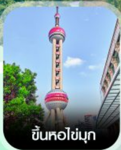
ขึ้นหอไข่มุก

✈️ คอนเฟิร์มออกเดินทาง ✈️ ทุกพีเรียด 2 ท่านขึ้นไป