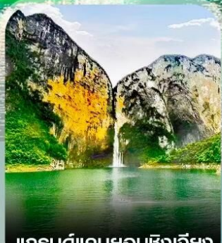
แกรนด์แคนยอนซิงเจี๋ย