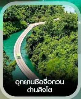
อุทยานชื่อจื่อกวน ด่านสิงโต

สัมผัสมหัศจรรย์ ถ้ำหลงหลินกง ธารน้ำสีมรกตใสราวกระจก แกรนด์แคนยอนผิงชาน ล่องเรือชมธรรมชาติ แกรนด์แคนยอนซิงเจี๋ย