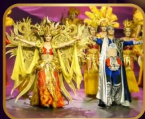
ชมสุดยอดโชว์ละครเวที