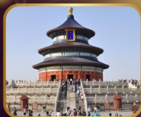
ชมความงดงาม