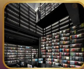
ชมร้านหนังสือ