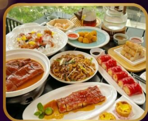
อาหารระดับ มิชลิน