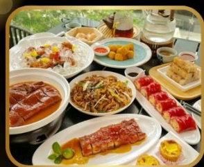
อาหารระดับ มิชลิน TAO TAO JU