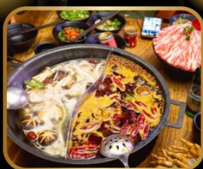
พิเศษ! เมนูหัวไฟ สุกี้ หม้อไฟสไตล์จีน