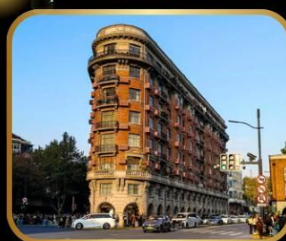
ถ่ายรูปจุดเช็คอิน WUKANG MANSION