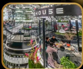
ภัตตาคารชื่อดัง WAREHOUSE NO.3