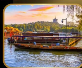
ล่องเรือ ทะเลสาบซีหู