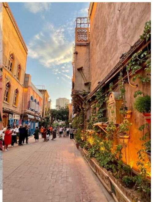
ถนนสายรุ้ง (Rainbow Alley)