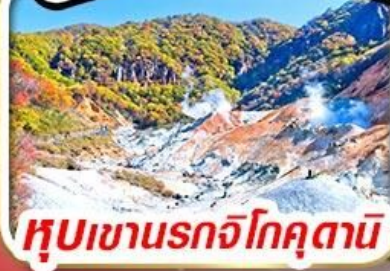
หุบเขานรกโจคุตานิ

รวม ค่าภาษีที่ปรับขึ้นแล้ว (ประกาศ 1 เม.ย. 69)