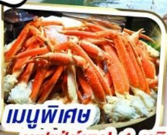
เมนูพิเศษ บุฟเฟ่ต์ชาบู 1 ชนิด