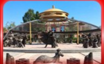
สวนวัฒนธรรมการแต่งพานวอร์ดอส