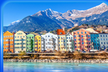
อาคารสีลูกกวาด อินส์บรุค