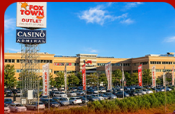
ฟ็อกซ์ทาวน์ ไอทาลี