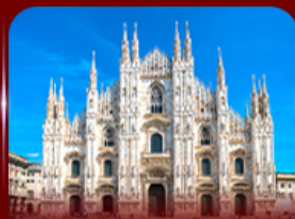
เชิควินมหาวิหารดูโอโม มิลาน