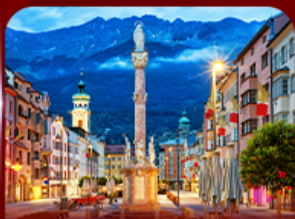
เที่ยวย่านเมืองเก่า อินส์บรุค