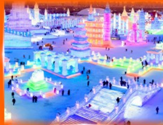
เที่ยว ICE & SNOW WORLD