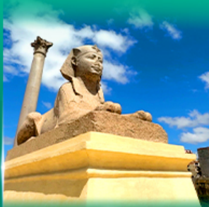
เสารัมมันปอมเปอี