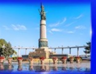
พิพิธภัณฑ์ ตุ๊กตาเป็ดตก