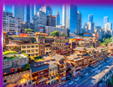
เข้คฉินย่านต้ง หงหยาศ้ง