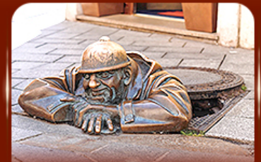
แลนด์มาร์คดัง รูปปั้นคูนิล ปรากติสลาวา