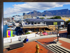
ท่าเรือ V&A waterfront