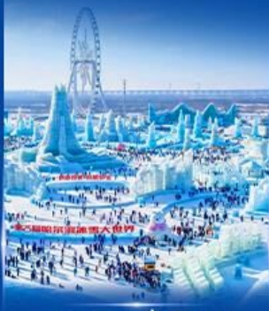
เทศกาลหิมะและน้ำแข็ง 2027