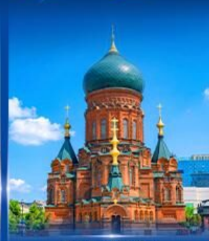
โบสถ์เซ็นต์โซเฟีย