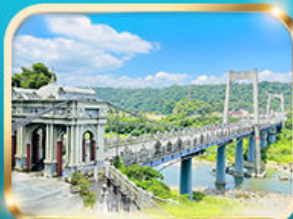
สะพานต้าซี เกาหยวน