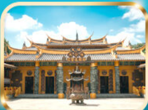
วัดต้าซี ซอกความรวย