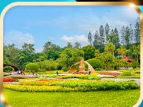
สวนบ้านปรน.เจียงไคเช็ก