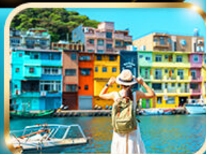
หมู่บ้านประมงเจิ้งปิ่น