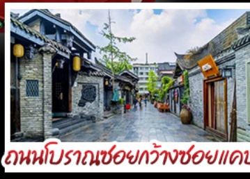
ถนนโบราณชอยกว้างชอยแคบ