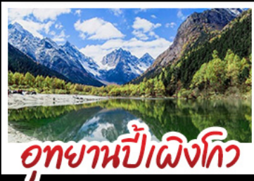
อุทยานป่าเฟื่องโกว