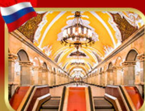
สถานีรถไฟใต้ดินกรุงมอสโก