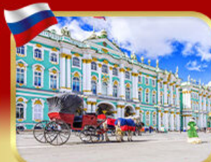
เช่าชมพิพิธภัณฑ์ออร์มิตา