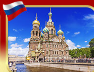
เซ็คอินโบสถ์แห่งหยดเลือด