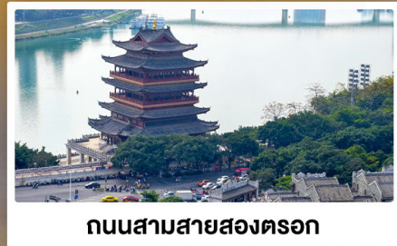
ถนนสามสายสองตรอก