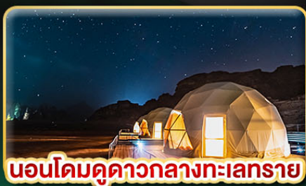
นอนโดมดูดาวกลางทะเลทราย

★ บินตรงสู่ “จอร์แดน” เยือน 7 มหัสจรรย์ของโลก