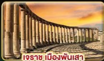
เอราซ เมืองพันเสา