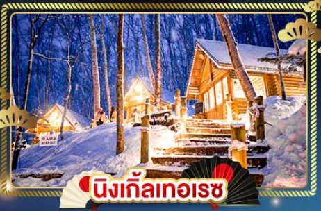
นิงเกิ้ลทอเรซ