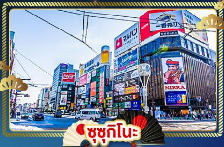
ซูซุกิโนะ