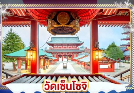
วัดเซ็นโซจิ

เที่ยวชมงานประดับไฟฤดูหนาว SAGAMIKO ILLUMINATION เช็กอินลานสกี ชมวิวภูเขาไฟฟูจิ