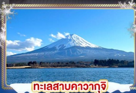
ทะเลสาบคาวากุจิ