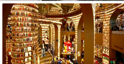
ร้านหนังสือจตุโก๋