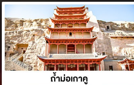
ถ้ำม่อเกาคุ