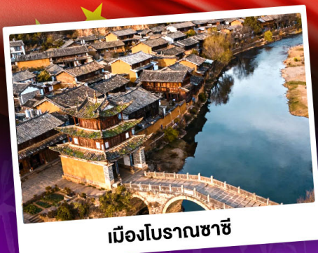
เมืองโบราณชาซี

ชมดอกไม้บานสะพรั่งทั่วยูนนาน "เซ็ดอี่นดาเฟ้ววี่สุดอลัง"