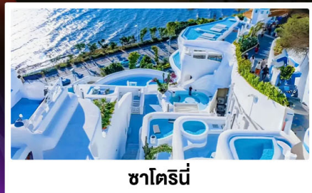
ซาไดร์นี่