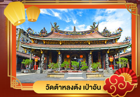
วัดต้าหลงตั้ง เป้าอัน