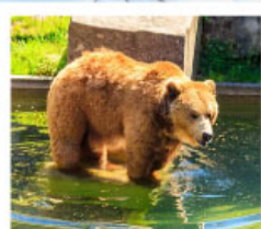
บ่อหมีเมืองเบิร์น