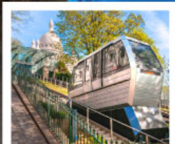
ขึ้นรางสู่ฆงมาร์ค