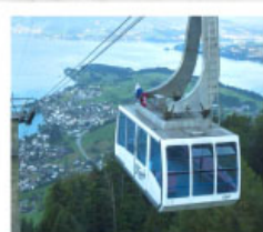
ขึ้นกระเช้ายอดเขาริกิ