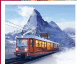
รถไฟเขากอนเนอร์เกรต