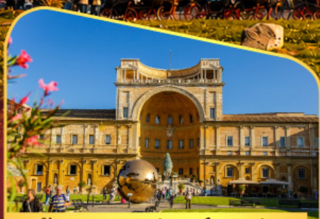
เข้าชมพิพิธภัณฑท์วาติกัน