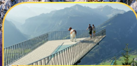
นั่งรถกระเช้าไฟฟ้า ชาร์เตอร์ คูส์ม