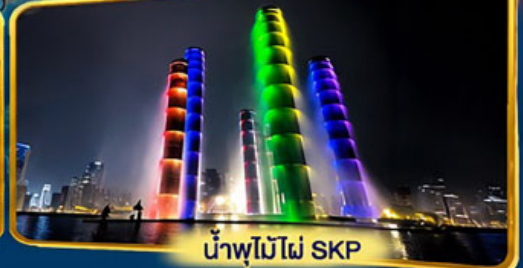
น้ำพุไม้ไผ่ SKP