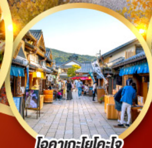
โอคาเกะโยโคโจ