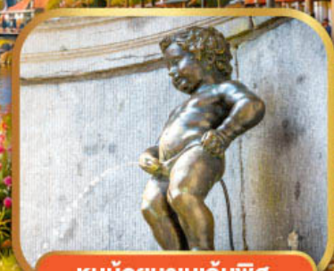
หนูน้อยมานกันพิส