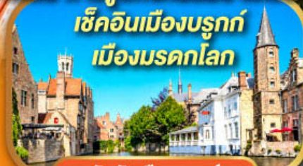
จัตุรัสเมืองบรูกซ์