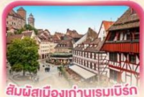
สี่มฬสเมืองท่าบูเรมเบิร์ก