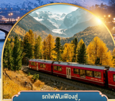
รถไฟฟันเฟืองสู่ยอดเขากรอนเนอริเกรต