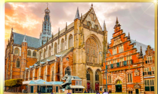
จัตุรัสเมืองฮาร์ลิม

พรมแดนเมืองแปลกเนเธอร์แลนด์และเบลเยียม เดินเมืองเคลฟท์ เมืองเครื่องปั้นดินเผาระดับโลก ฮาร์ลิมเมืองมั่งคั่งที่สุดของเนเธอร์แลนด์