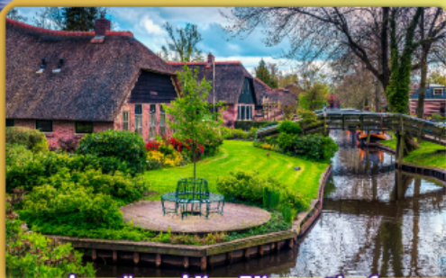
ล่องเรือหมู่บ้านไรทอนท์รูร์น