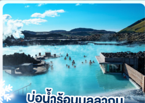
♨️ แช่น้ำร้อนบลูลากูน

เก็บไอซ์แลนด์ เดนมาร์ก ไฟร์คirkจุฬ และ แช่น้ำร้อนบลูลากูน