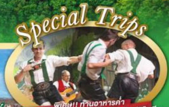
พิเศษ!! ท่านอาหารค่ำ พร้อมชมการแสดงดนตรีพื้นเมืองสไตล์โรสเชียร์ และเขื่อนเมืองอูเทรคต์ สีสันใหม่เนเธอร์แลนด์