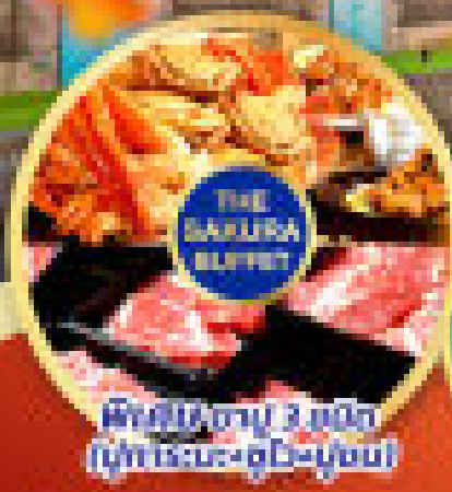
เพลิดเพลินกับ 3 มื้อพิเศษ บุฟเฟ่ต์: ซาคุระ-บลินด์