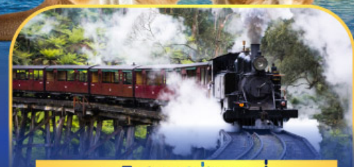
รถไฟพั้งบิลลี่

ล่องเรือชมอ่าวซิดนีย์พร้อมรับประทานอาหารกลางวัน และ เข้าชมสวนสัตว์การองก้า